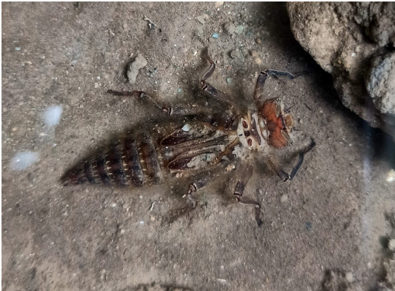
2. ábra: Balkáni hegyiszitakötő ( Cordulegaster heros ) lárva

A lárvák és az imágók faji azonosításához AMBRUS et al. (1992a, 2018) munkáit használtuk, ezekkel a határozás terepen is elvégezhető, szükség esetén távcső, fényképezőgép, nagyító segítségével. A helymeghatározáshoz Garmin GPSMAP 64 GPS készüléket használtunk. A terepen gyűjtött pozíció adatok feldolgozása, ábrázolása QGIS 3.32 térinformatikai programmal történt, Map tiler© OpenStreetMap© alaptérképen.