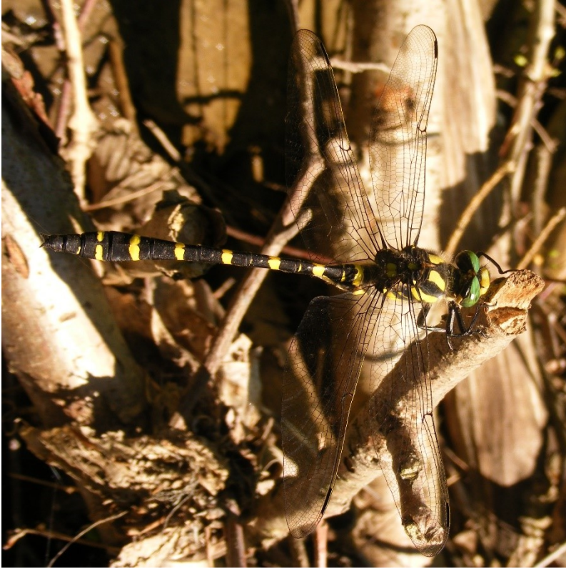
3. ábra: Balkáni hegyiszitakötő ( Cordulegaster heros ) imágó

Az előkerült lárvák látványosan eltérő mérete (kicsi, közepes, nagy) arra utal, hogy több különböző korú lárvastádium példányait is megtaláltuk. A gyűjtés időpontjából visszavezetve ez azt jelenti, hogy a faj ezen a lelőhelyen biztosan átvészelte az országosan sok kisvízfolyás kiszáradását eredményező, a HUNGAROMET (2024) adatai szerint 1901 óta a legszárazabb évek első negyedébe tartozó 2021-es és 2022-es évet is.