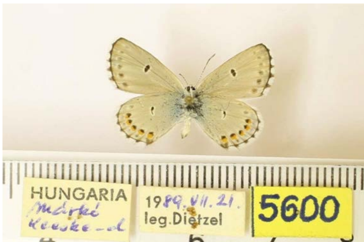
13. ábra: A „ Pseudophilotes vicrama schiffermülleri ab. dahlstroemi ” Dietzel, 1991 holotípus példánya alulnézetben és cédulái

Rubrapterus bavius (Eversmann, 1832) (Lycaenidae, Pal) – Fiók: 22.34. Nevek: casimiri . Példányok: GR (1).