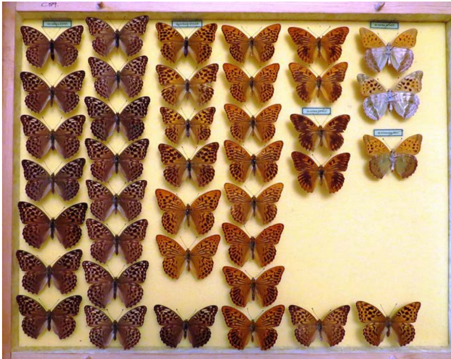
2. ábra: A Dietzel-lepkegyűjtemény F06-os jelzésű fiókja eredeti elrendezésben, Nagy csillér ( Argynnis paphia )-anyagokkal, benne számos „f. valesina”, illetve érdekes egyedi eltérés példányával

A Magyar Természettudományi Múzeum Bakonyi Természettudományi Múzeuma (Zirc) 2019-ben vásárolta meg Dietzel Gyula lepkegyűjteményét, amely eredetileg 144 nagyméretű és 46 kisméretű tárlófióknyi lepkéből állt a tulajdonos berhidai házában dolgozószobájában. Mivel a fiókok nem zártak megfelelőképpen, a teljes anyagot a múzeum munkatársai áttűzték a külön erre a célra vásárolt új tárlókba. A gyűjtemény jelenleg a múzeum rovargyűjteményének 21. és 22. számú szekrényében található, amelyekben 50, illetve 42 fiók tartalmazza a megvásárolt 9817 példányt, az eredeti névcédulákkal (2–5. ábra).