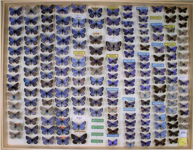
5. ábra: A Dietzel-lepkegyűjtemény 22.37. számú tárlófiókja jelenlegi elrendezésében. Az egykor H13 jelzetű fiók anyaga mellé további Boglárkarokonú (Polyommatus)-példányok is bekerültek az előző (H11–12) és a következő (H14) fiókokból