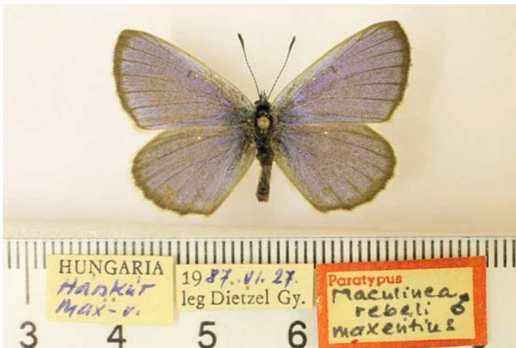
10. ábra: A Maculinea xerophila maxentius Dietzel, 1997 holotípus példánya felülnézetben és cédulái. A példányra eredetileg (tévedésből?) nem holotípus, hanem paratípus cédula került

Maculinea alcon ([Schiffermüller], 1775) (Lycaenidae, Pal) – Fiók: 22.36, 22.37. Nevek: Maculinea alcon , Maculinea tolistus , Maculinea xerophila . Példányok: H (123), RO (3). Jegyzet: A magyarországi példányok között lelhető fel a Maculinea xerophila maxentius Dietzel, 1997 holotípusa és további paratípus példányai (10. ábra).