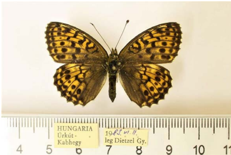
7. ábra: A Brenthis ino simulatrix Dietzel, 1990 egyik nőstény szüntípus példánya felülnézetben és cédulái