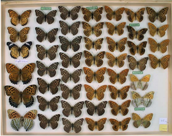
3. ábra: A Dietzel-lepkegyűjtemény 22.16. számú tárlófiókja jelenlegi elrendezésben. A Nagy csillér ( Argynnis paphia )-anyagokat tartalmazó egykor F06 jelzetű fiók anyaga mellé az előző (F05) és a következő (F07) fiókokból is bekerültek példányok