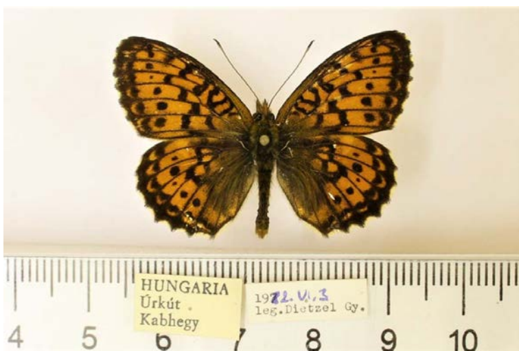
6. ábra: A Brenthis ino simulatrix Dietzel, 1990 egyik hím szüntípus példánya felülnézetben és cédulái