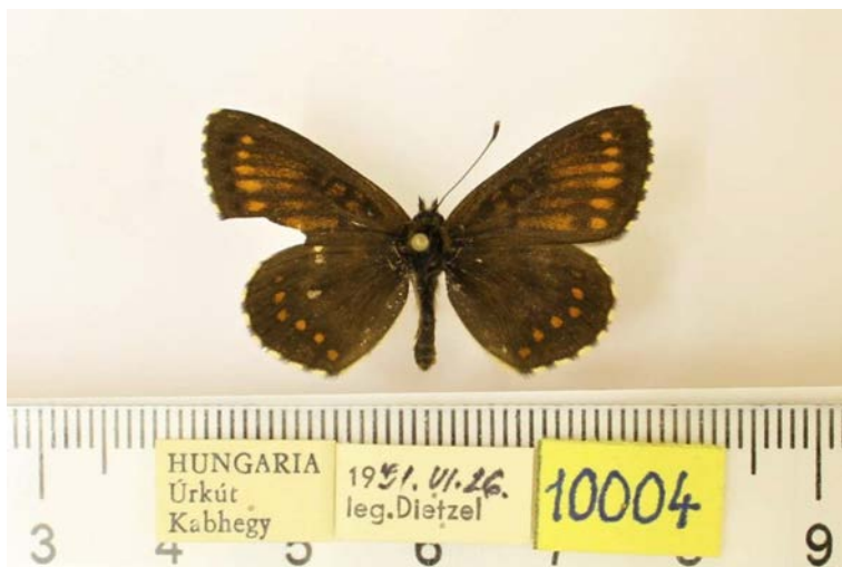
12. ábra: A “ Melitaea britomartis centroposita ab. cymothorina ” Dietzel, 1991 holotípus példánya felülnézetben és cédulái

Melitaea britomartis Assmann, 1847 (Nymphalidae, Pal) – Fiók: 22.19. Nevek: Melitaea britomartis . Példányok: H (63). Jegyzet: A példányok között lelhető fel a „ Melitaea britomartis centroposita ab. cymothorina ” Dietzel, 1991 holotípusa (BÁLINT & KATONA 2017: 12). A példányok jelentős része nevelt, számos érdekes egyedi eltéréssel (12. ábra).