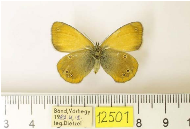
8. ábra: A „ Coenonympha arcania cephalus ab. cessexa ” Dietzel, 1991 holotípus példánya alulnézetben és cédulái

Coenonympha arcania (Linnaeus, 1761) (Nymphalidae, Pal) – Fiók: 21.27. Nevek: Coen. arcania , cephalus , cessexa , serenella , tennelimbo . Példányok: H (74), I (4). Jegyzet: A magyarországi példányok között található a „ Coenonympha arcania cephalus ab. cessexa ” Dietzel, 1991 holotípus példánya (8. ábra).