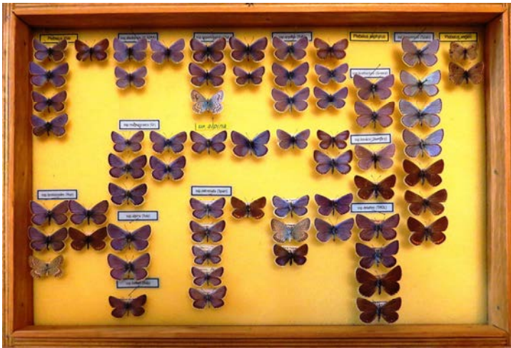
4. ábra: A Dietzel-lepkegyűjtemény H13-as jelzetű fiókja eredeti elrendezésben, benne különböző Boglárkarokonú ( Polyommatus )-fajokkal, köztük magyarországi Zefír boglárka ( Plebejides sephirus )-példányokkal