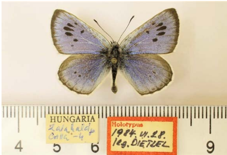
11. ábra: A Maculinea arion annarion Dietzel, 1990 lektotípus példánya felülnézetben és cédulái

Maculinea arion (Linnaeus, 1758) (Lycaenidae, Pal) – Fiók: 22.36, 22.37. Nevek: Maculinea arion , indet, ligurica , obscura , punctifera , subtusbrunnea ? Példányok: CH (1), H (68), I (13), SK (4). Jegyzet: A magyarországi példányok között található a Maculinea arion annarion Dietzel, 1990 lektotípusa és számos paralectotípus (vö. BÁLINT 2015; BÁLINT & KATONA 2017: 12) (11. ábra).