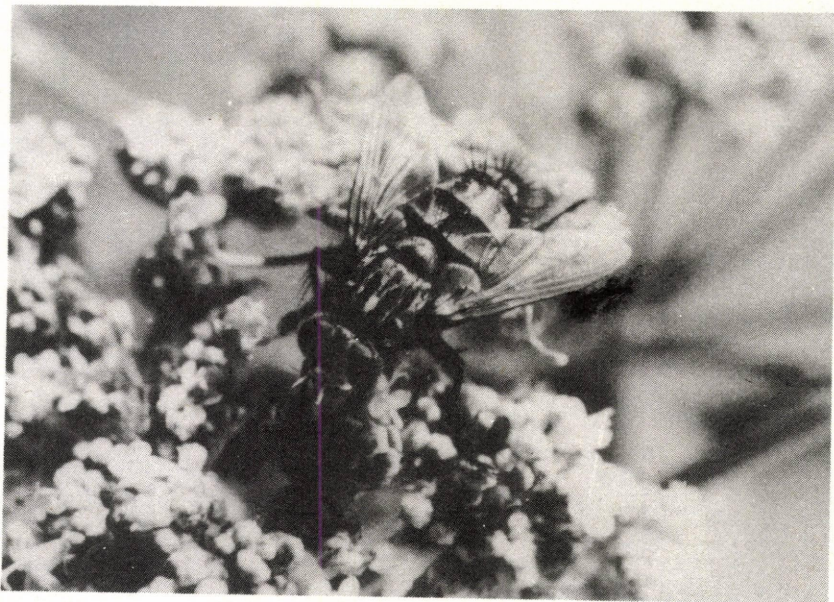
4. ábra - Abb. 4: Exorista larvarum L.