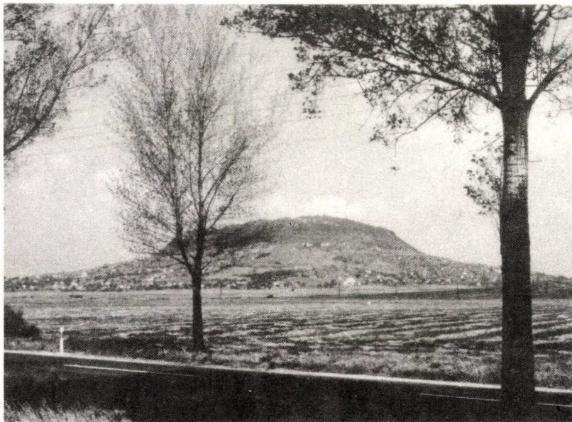
5. ábra: A fűzfaszövő hernyói által lerágott nyárfa a 8-as műút mellett, háttérben a Somló Abb. 5: Die Schädigung der Raupen von Leucoma salicis L.