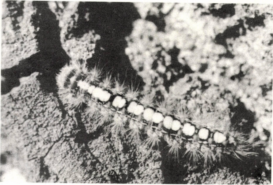
2. ábra: A fűzfaszövő / Leucoma salicis L./ hennyőja Abb. 2: Die Raupe von Leucoma salicis L.