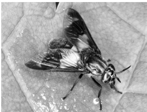
4. ábra: Közönséges pócsik ( Chrysops caecutiens )

Chrysops caecutiens (Linnaeus, 1758)(4. ábra): Gátvereti-legelő: 2008.07.08. (5), VT; Hegyesdihalastó: 1981.06.04. (1), VT; 1981.06.09. (1), VT; Imretanya: 2012.06.21. (4), VT; 2012.08.08. (3), VT; 2013.07.11. (2), VT; 2013.07.18. (4), VT; 2013.07.26. (2), VT; 2013.07.28. (4), VT; 2013.08.01. (3), VT; 2013.08.02. (3), VT; 2013.08.06. (1), VT; 2013.08.09. (3), VT; Pokol-tó: 2005.07.23., 1♂ 5♀, TS.