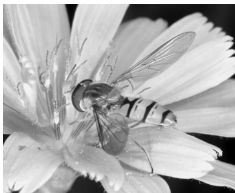
5. ábra: Ékfoltos zengőlégy ( Episyrphus balteatus )