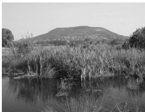
2. ábra: Piroscser, háttérben a Szent György-hegy