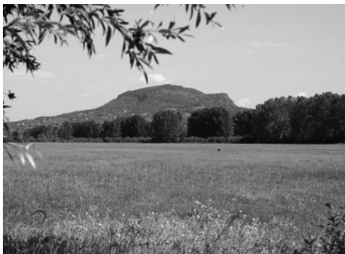
1. ábra: A Pap-rét Szigliget mellett

Az anyag feldolgozását a szerzők végezték. A közölt anyagból egyes példányok helyet kaptak az MTM Bakonyi Természettudományi Múzeumának gyűjteményében is.