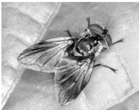
6. ábra: Szélespotrohú poloskafürkész Ectophasia crassipennis