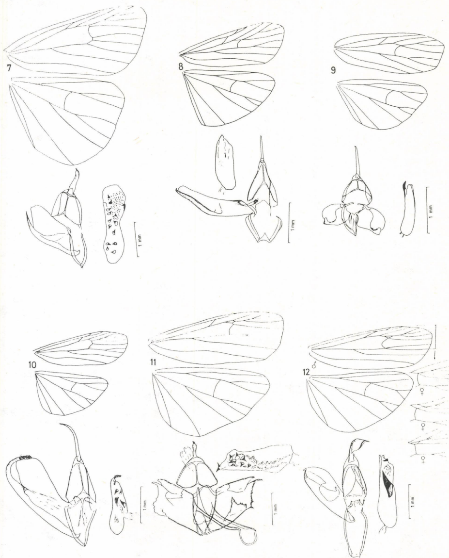
Abb. 7. - 7. ábra: Cybosia mesomella L., gen. prep. Fazekas I.No. 1710. Abb. 8. - 8. ábra: Pelosia muscerda Hufn., gen. prep. Fazekas I.No. 1725. Abb. 9. - 9. ábra: Pelosia obtusa H.-Sch., gen. prep. Fazekas I.No. 1639. Abb. 10. - 10. ábra: Eilema sororcula Hufn., gen. prep. Fazekas I.No. 1727. Abb. 11. - 11. ábra: Eilema griseola Hbn., gen. prep. Fazekas I.No. 1706. Abb. 12. - 12. ábra: Eilema caniola Hbn., gen. prep. Fazekas I. No. 1465.