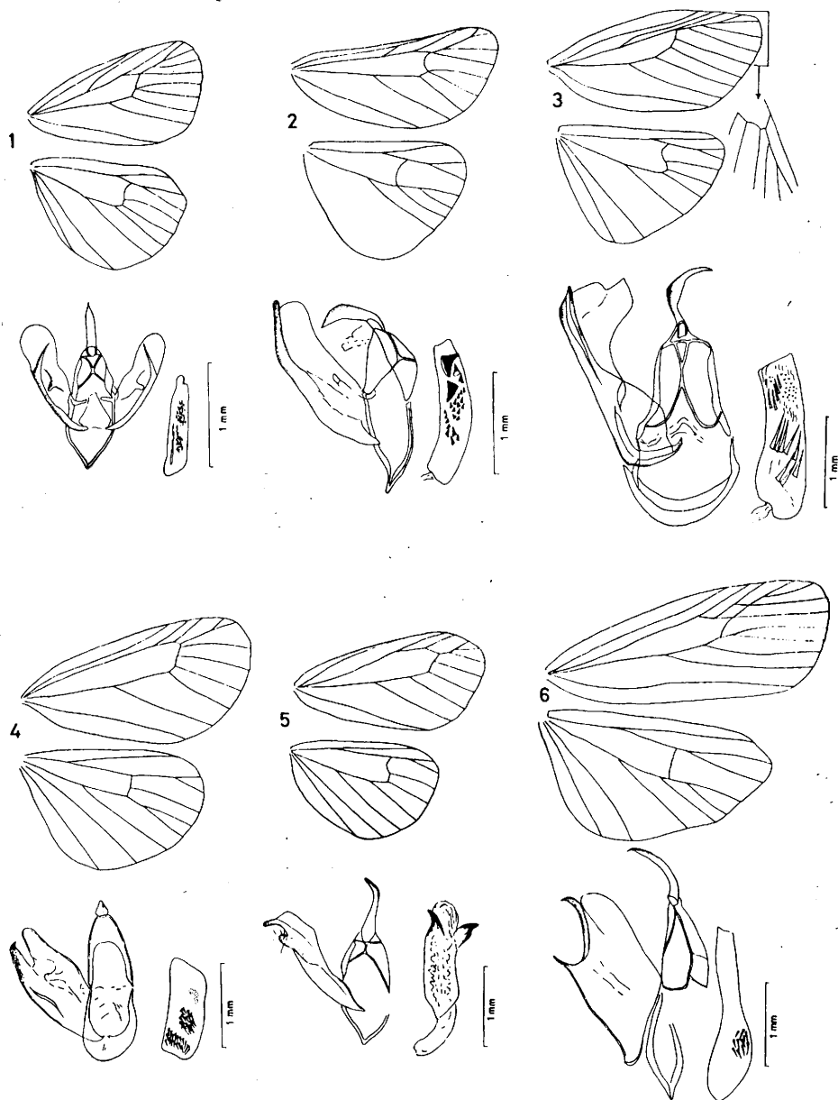
Abb. 1. - 1. ábra: Tumatha senex Hbn., gen. prep. Fazekas I. No. 1709. Abb. 2. - 2. ábra: Setina roscida D. S., gen. prep. Fazekas I. No. 1705. Abb. 3. - 3. ábra: Miltochrista miniata Forst., gen. prep. Fazekas I. No. 1707 Abb. 4. - 4. ábra: Paidia murina Hbn., gen. prep. Fazekas I. No. 1716. Abb. 5. - 5. ábra: Nudaria mundana L., gen. prep. Fazekas I. No. 1708. Abb. 6. - 6. ábra: Atolmis rubricollis L., gen. prep. Fazekas I. No. 1724.