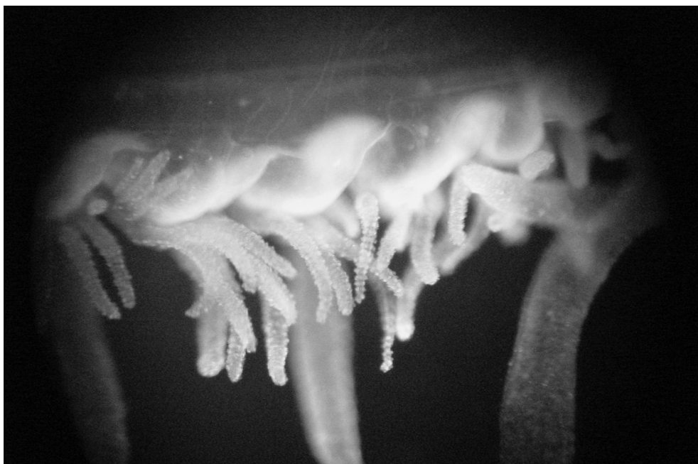
1. ábra: Craspedacusta sowerbii tapogatói (Pisztrángos-tó, Farkasgyepű) Figure 1: Tentacles of Craspedacusta sowerbii (from Lake Pisztrángos)

Az édesvízi medúzát három hazai tavunkban, az Abda illetve Győrújfalu határában fekvő kavicsbánya tavakban, valamint a farkasgyepűi Pisztrángos-tóban találtuk meg ( 2. ábra ). A bányatavakat 2007. szeptember 4-én hőmérsékleti rétegződésük vizsgálatának céljából mintáztuk. Az abdai bányatóban akkor kb. 3–4 egyed volt megfigyelhető a part közelében, míg a