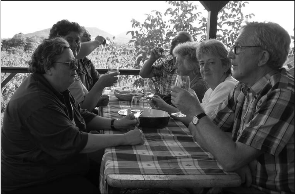
3. kép: Borozás a Szászi-pincében a Szent György-hegy megmászása után