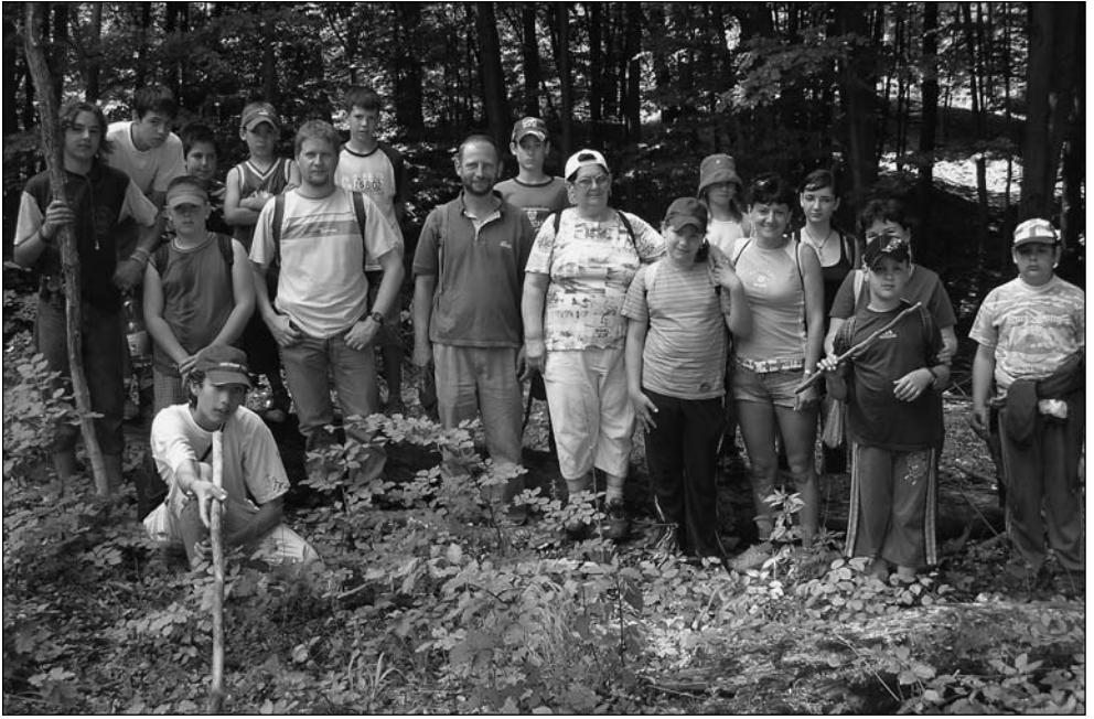
7. kép: A Szekrényeskő-árokknál 2007-ben