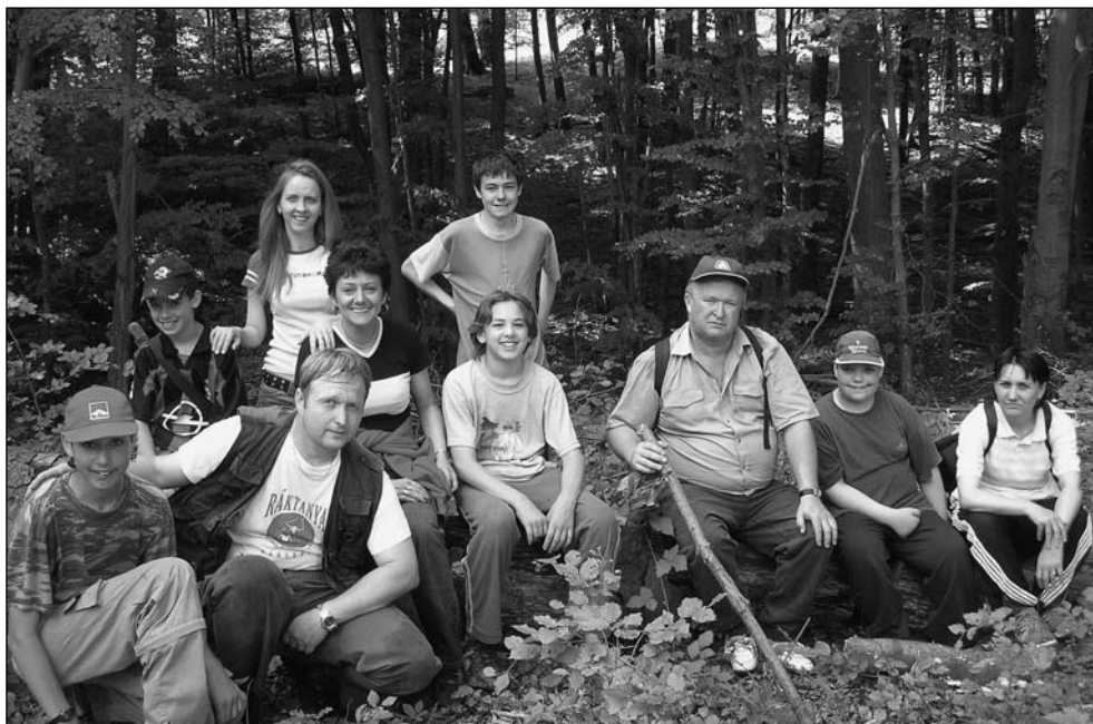
2. kép: A Szekrényeskő-árokknál 2006-ban