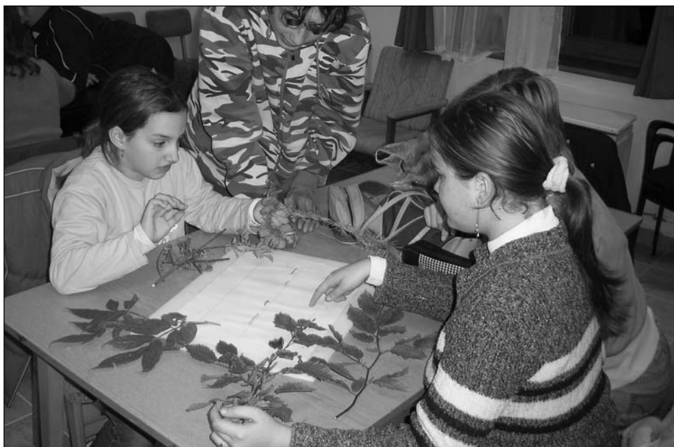
5. kép: Természetismereti vetélkedő felső tagozatos diákoknak