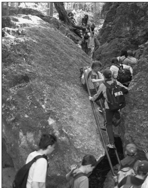
6. kép: Átkelés a Gizella-átjárón